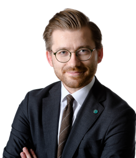
Klima- og miljøminister Sveinung Rotevatn (TBA)

SJØMATKONFERANSE I MÅLØY 31. AUGUST PÅ PARKEN KULTURHUS (RAUDEBERG)