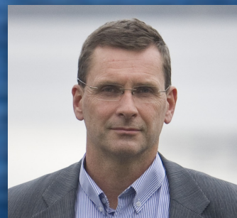
Ocean Forest, Lerøy Harald Sveier