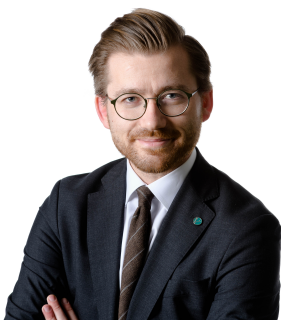
Klima- og miljøminister Sveinung Rotevatn

SJØMATKONFERANSE I MÅLØY 31. AUGUST PÅ PARKEN KULTURHUS (RAUDEBERG)