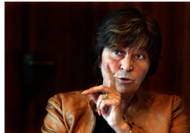
Gerd Kristiansen, leiar for LO i Norge.